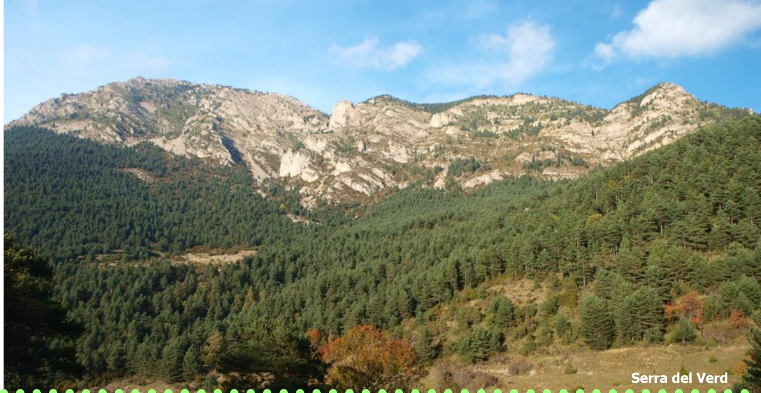
Serra del Verd