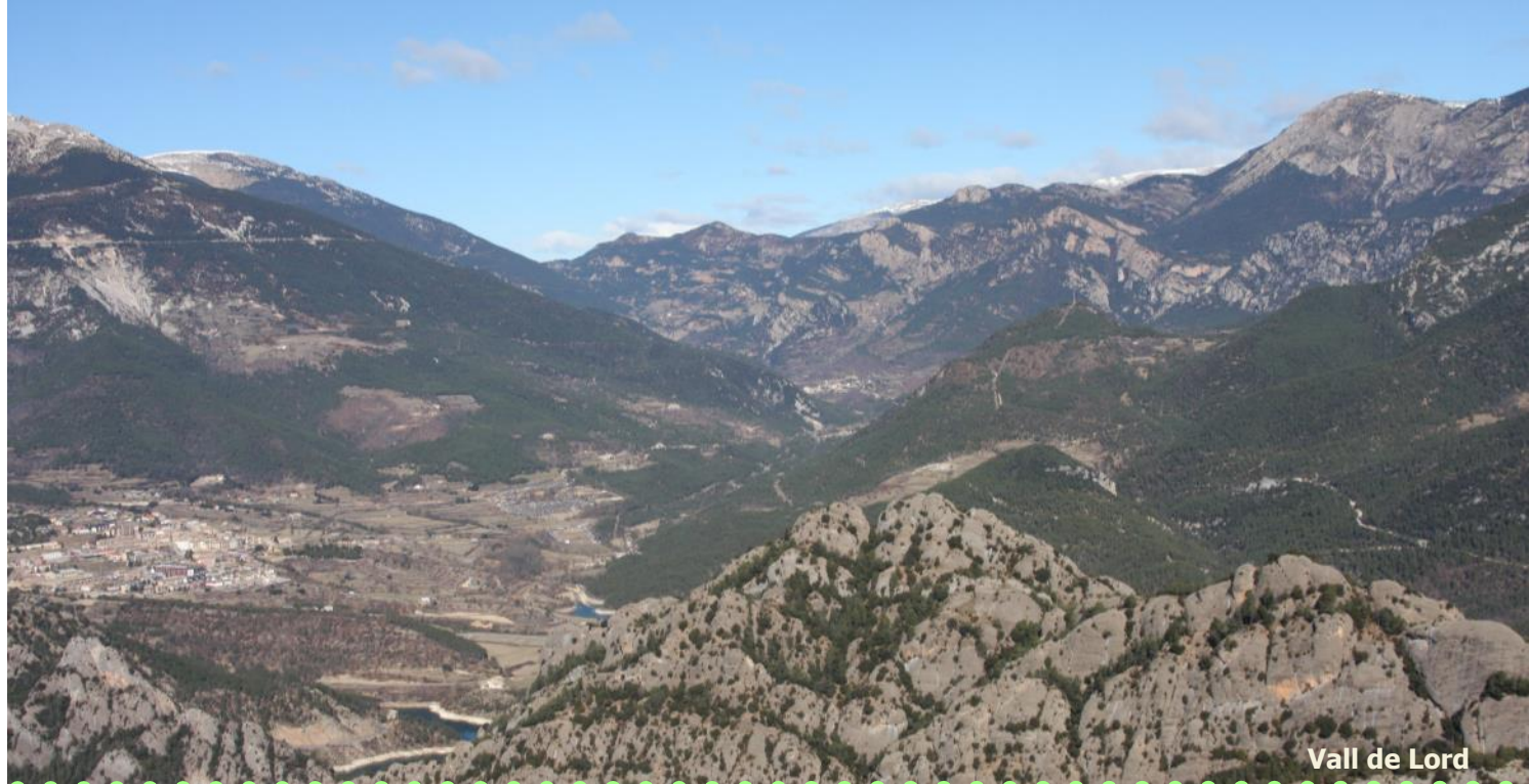
Vall de Lord